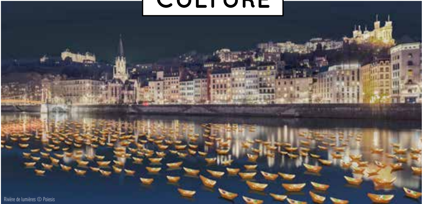
Rivière de lumières

KIDS FRIENDLY &amp; GRATUIT DU 05 AU 08/12